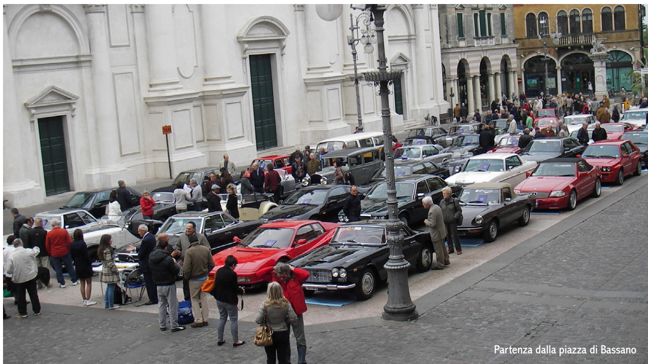
Partenza dalla piazza di Bassano

Ad adesione confermata e mancata partecipazione si deve comunque corrispondere il pagamento della quota, perché l'organizzazione avrà comunque fatto prenotazioni e sostenuto costi per il numero di adesioni arrivate. La quota di partecipazione è fissata a 35 Euro a persona, salvo costi aggiuntivi per visite o extra definiti nel programma definitivo che per i motivi già detti non è ancora completato.