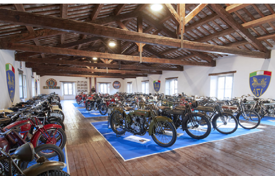
Museo Collezione ASI-Morbidei

Dopo essere stata acquisita dall'ASI nell'agosto 2020, la Collezione Morbidelli ha trovato una nuova collocazione all'interno del Museo Officine Benelli di Pesaro. Grazie all'impegno congiunto e alla collaborazione tra ASI, Registro Storico Benelli e Comune di Pesaro, e con la continua supervisione del Ministero per i Beni e le Attività Culturali, questa straordinaria Collezione composta da 71 motociclette storiche tornerà presto a disposizione degli appassionati di tutto il mondo.