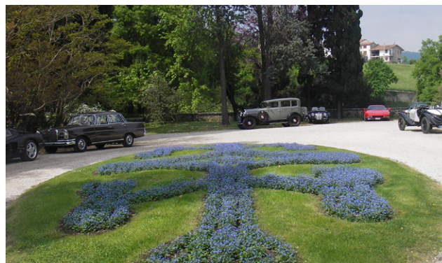
Le nostre vetture parcheggiate a Villa Trissino Marzotto

Cominciate a riscaldare i motori e lucidare le carrozzerie. Partecipiamo in serenità tutti insieme. Per le prenotazioni e iscrizioni si può fare riferimento alla segreteria o dare l'adesione con messaggio nel gruppo whatsapp "amici auto storiche CVAE" pubblicizzato nei precedenti notiziari.