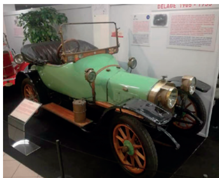
La Delage fa bella mostra di sé all'ingresso del Museo