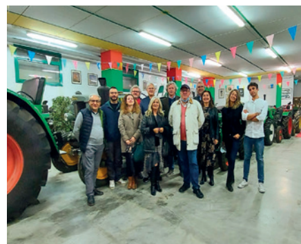
L'incredibile collezione di trattori del San Piero