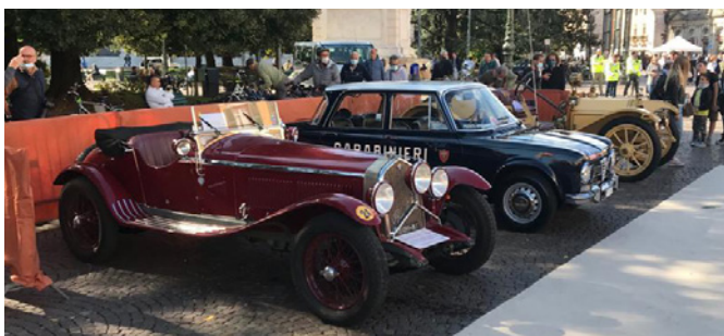
L'Alfa Romeo 1750 SS del nostro Museo Bonfanti-VIMAR