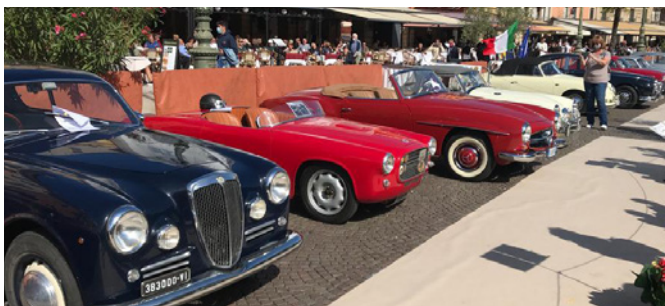
In primo piano la capostipite delle Gran Turismo - la Lancia Aurelia B20 GT