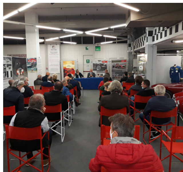
Il Museo gremito rispettando le normative Covid 19