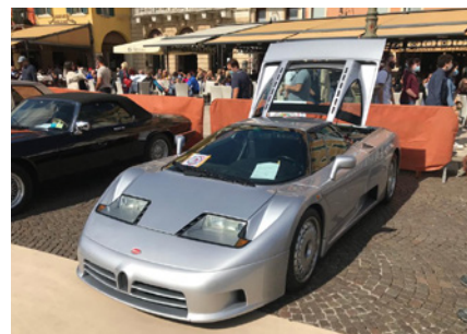
Bugatti EB 110