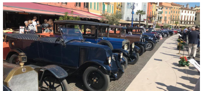
La rarissima Isotta Fraschini Fenc del 1908 capofila delle vetture più datate