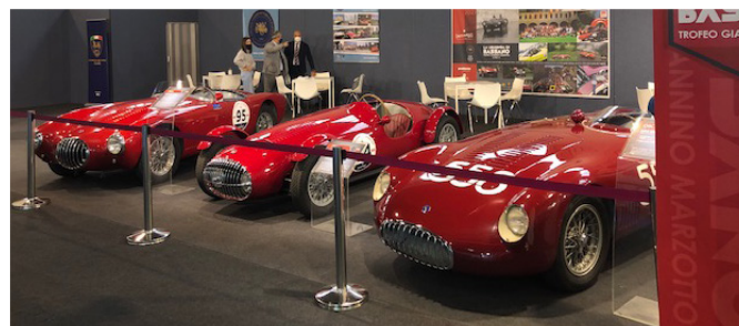
Il nostro stand con le 3 OSCA

È disponibile presso la sede del CVAE la seconda edizione dell' "Enciclopedia del Motorismo Mobilità e Ingegno Veneto". Questa edizione, rivista, corretta e ampliata rispetto alla prima, consiste in un'opera che conta oltre 1000 voci, in quasi 400 pagine, raccontando tutto ciò che è stato scoperto in trent'anni di ricerca sul motorismo, e non solo, della nostra regione. Un'eccellenza che solo il nostro club può vantare, un'opera che non può mancare nella biblioteca di ogni appassionato. L'Enciclopedia è stata messa in vendita al pubblico al prezzo di € 65,00, ma eccezionalmente solo per i soci CVAE è possibile acquistarla presso la sede al prezzo di € 40,00.