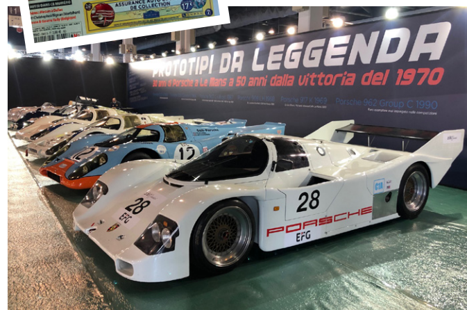
Porsche a Le Mans